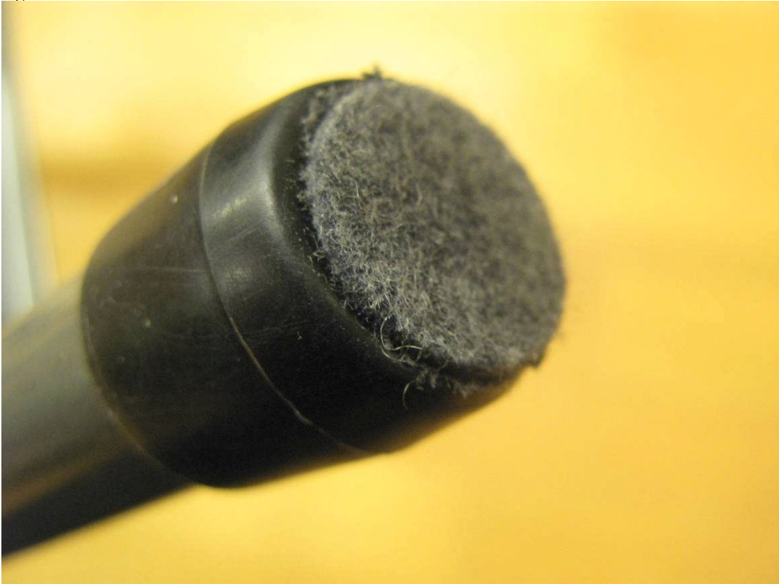
Figur 10 Ackurat möbeltass