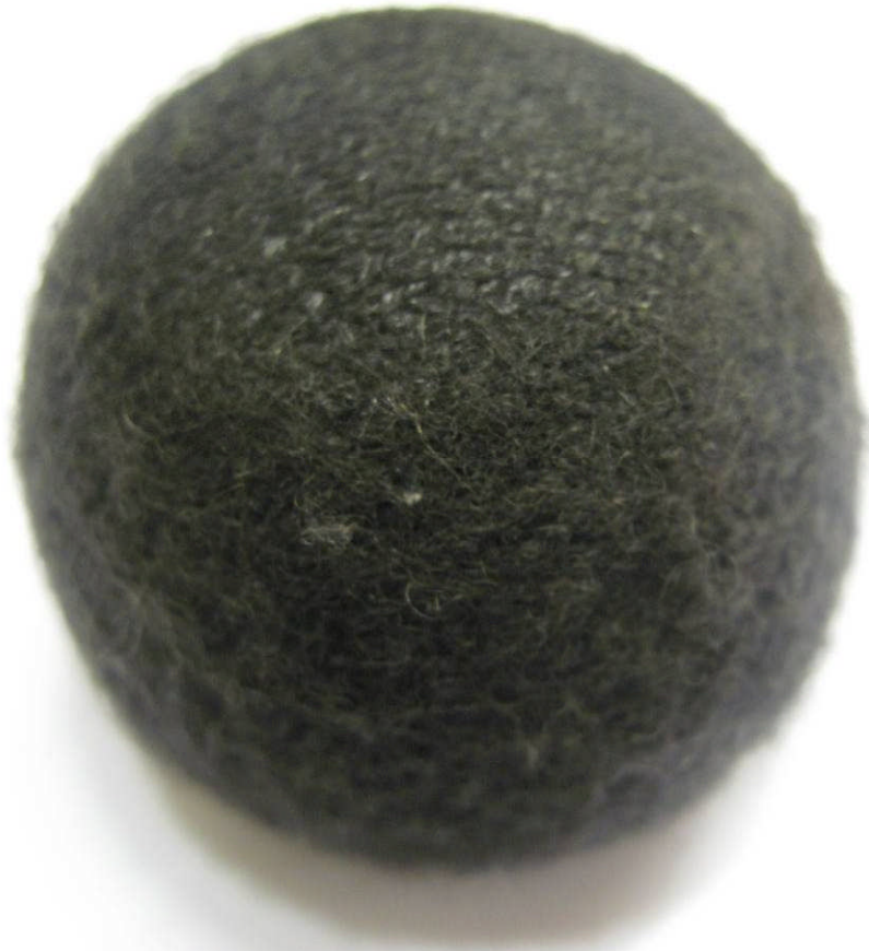
Figur 3 Silent Socks B1 efter 40 000 cykler