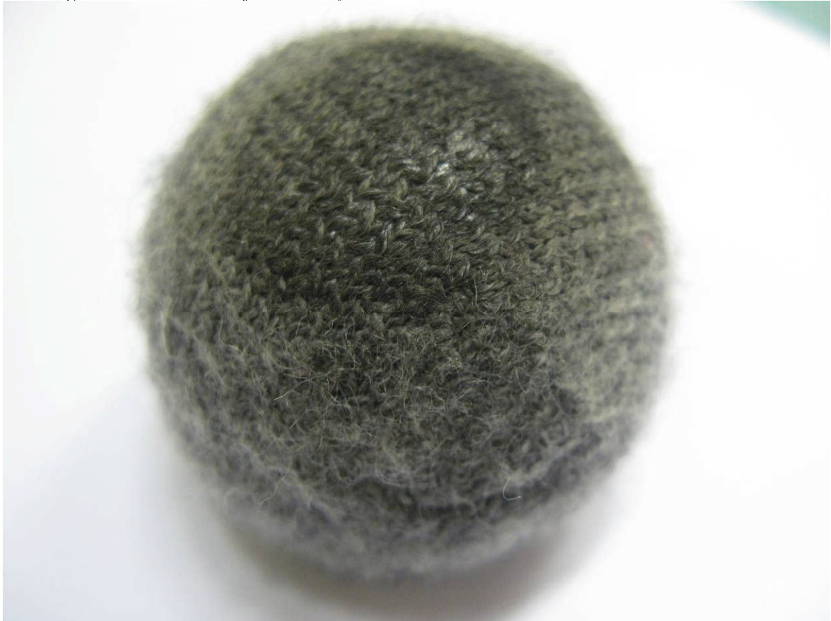
Figur 4 Silent Socks B2 efter 40 000 cykler