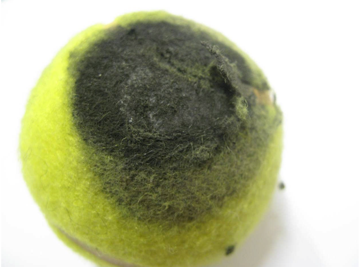
Figur 7 Tennisboll 1 efter 23 000 cykler