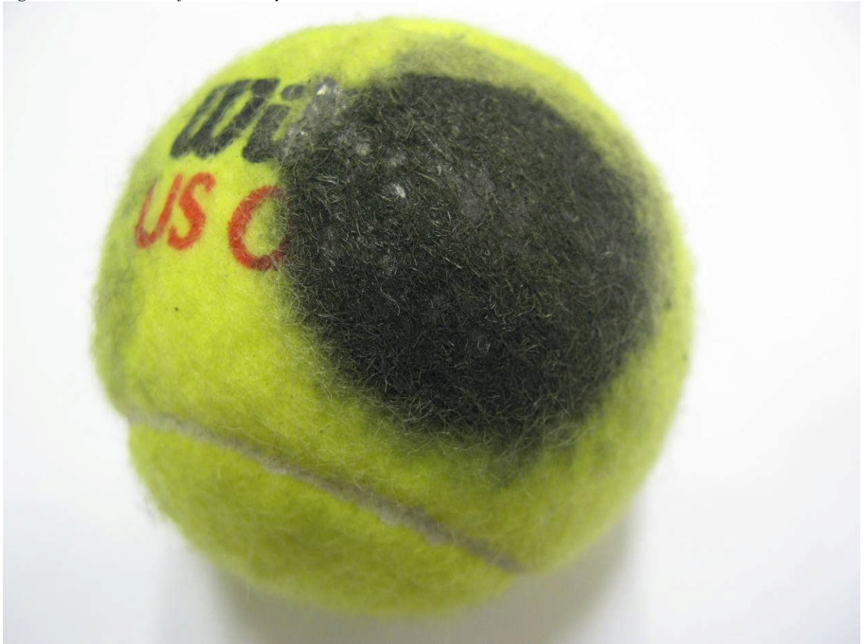
Figur 8 Tennisboll 2 efter 23 000 cykler