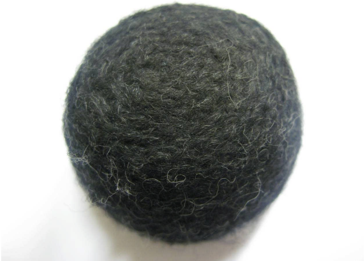
Figur 2 Silent Socks A efter 40 000 cykler