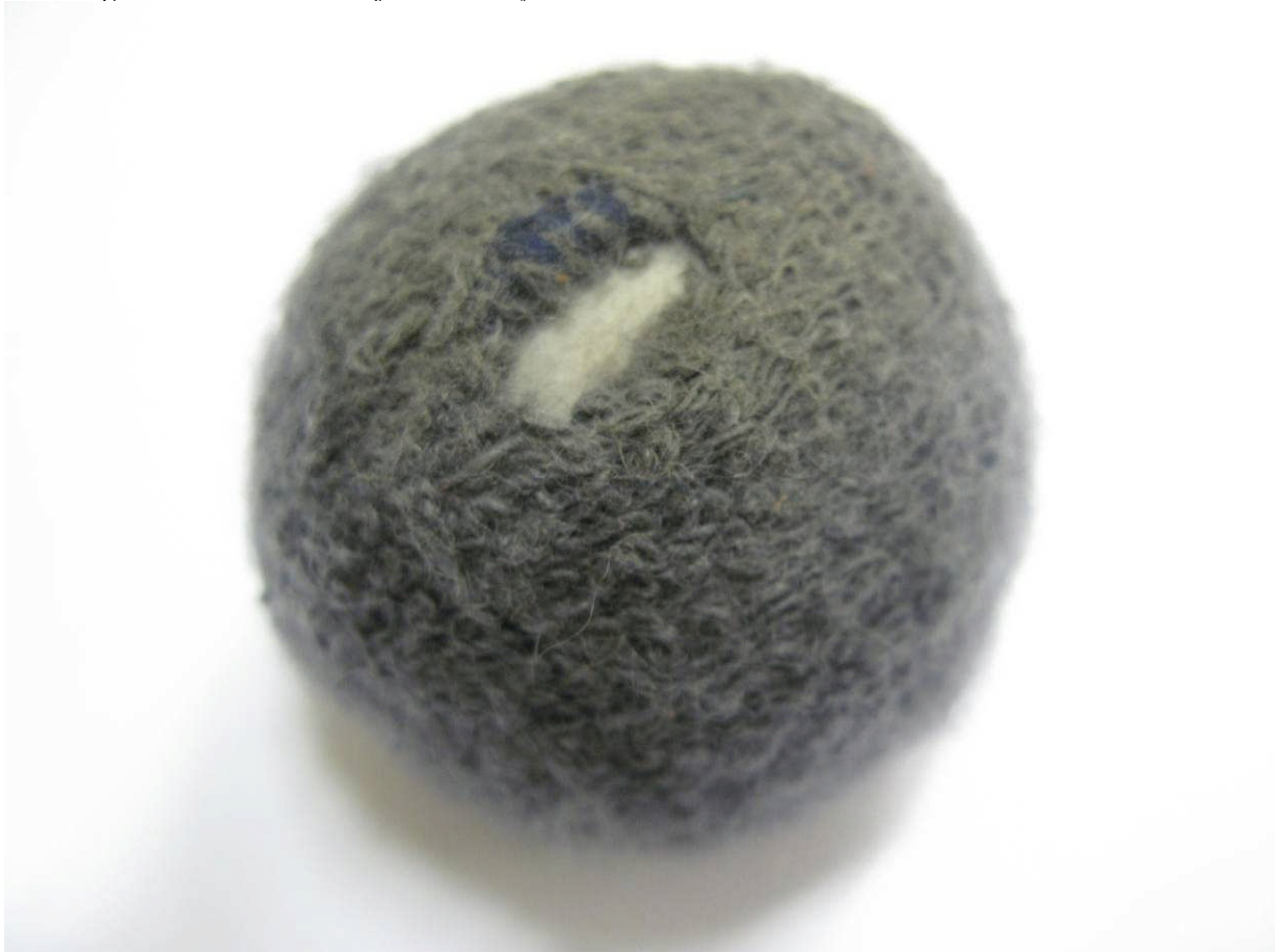
Figur 5 Silent Socks C1 efter 23 000 cykler