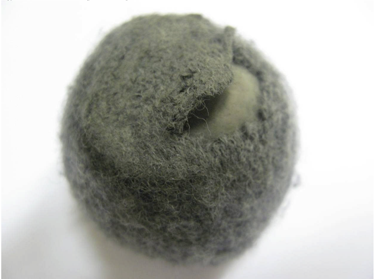
Figur 6 Silent Socks C2 efter 5 000 cykler