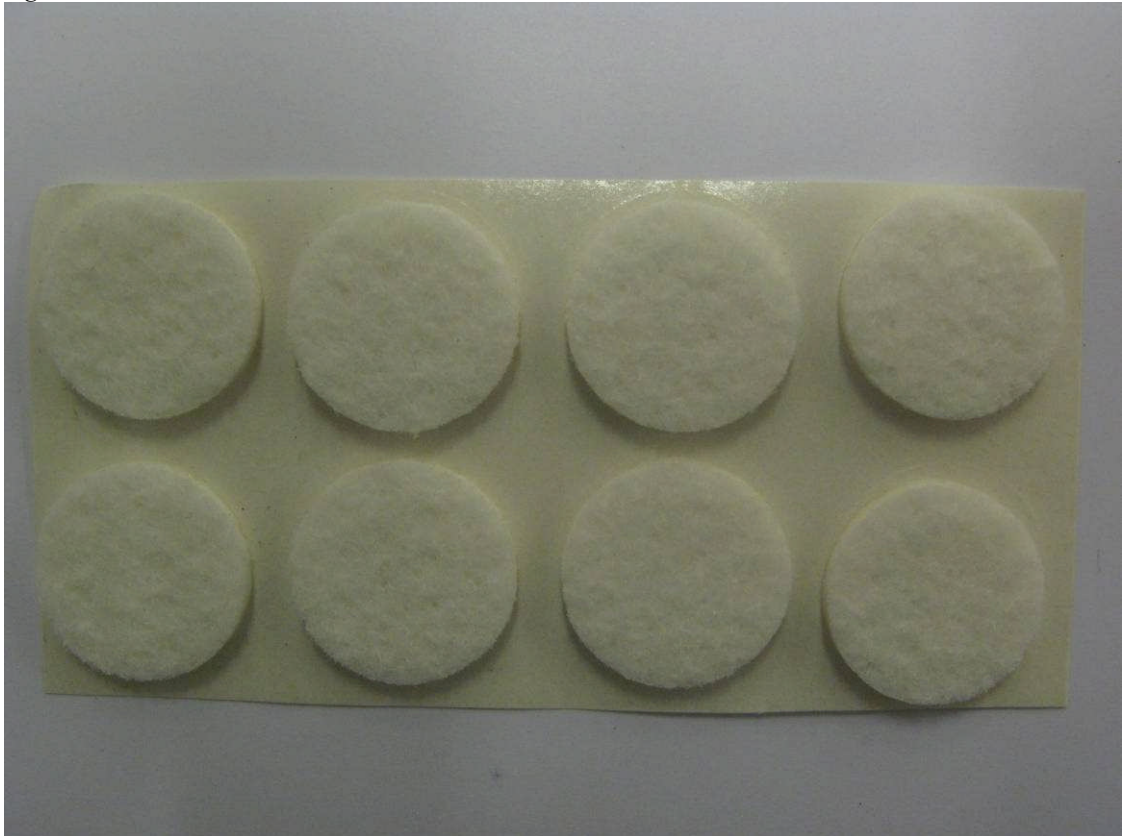
Figur 9 Ikea Möbeltass Praktisk