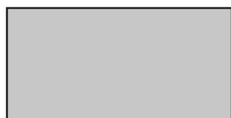
1200x590 mm liggande montage